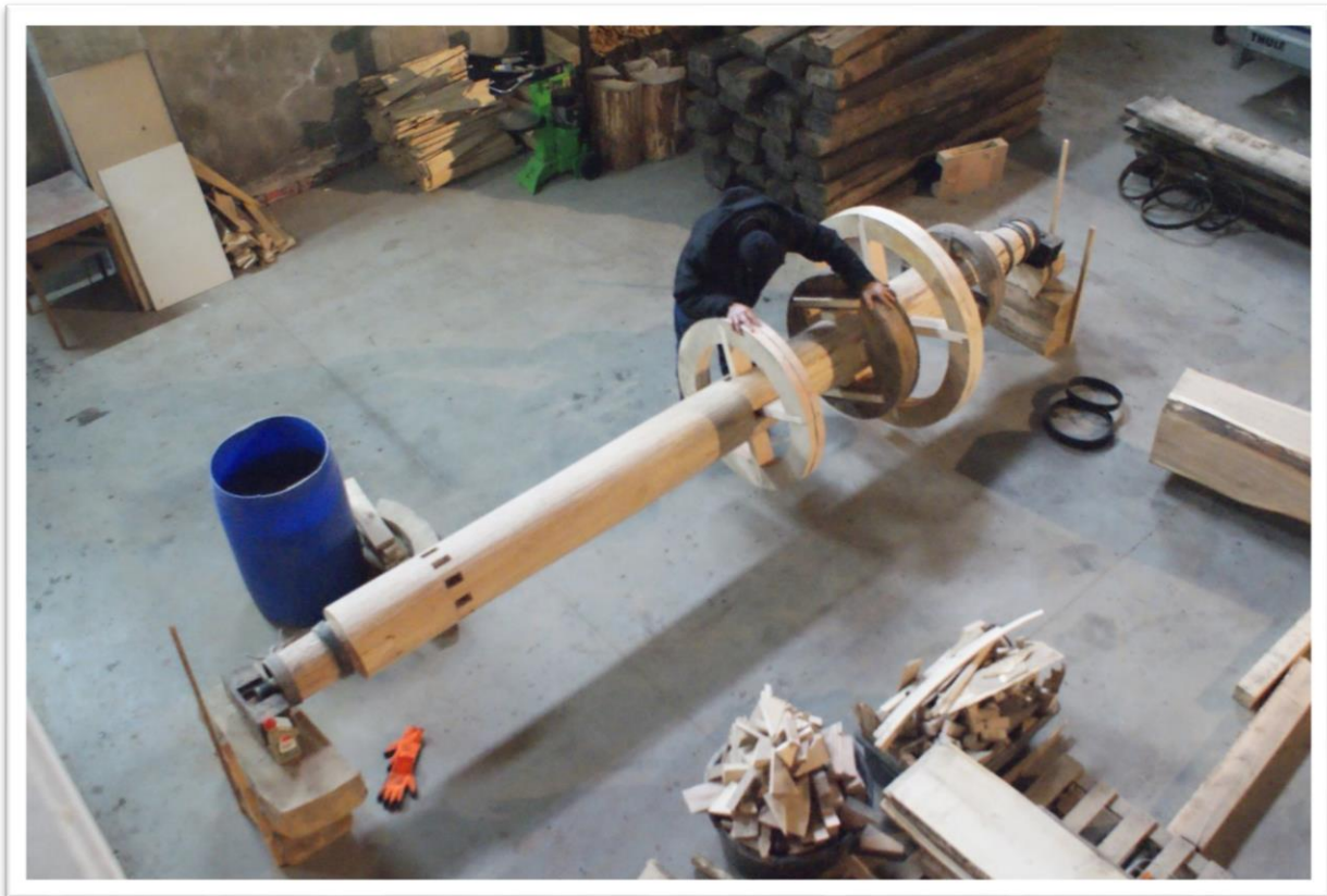
Folusz z Krościenka