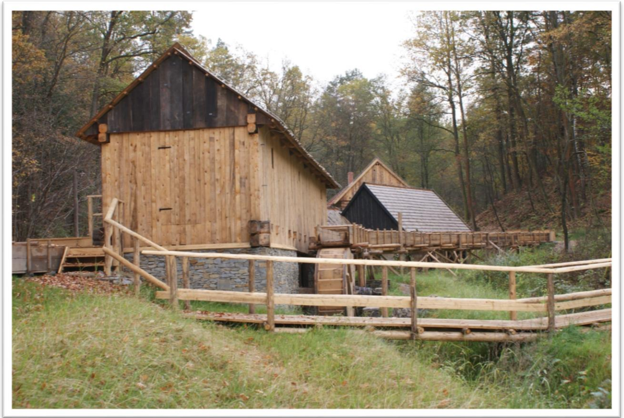
Folusz z Krościenka