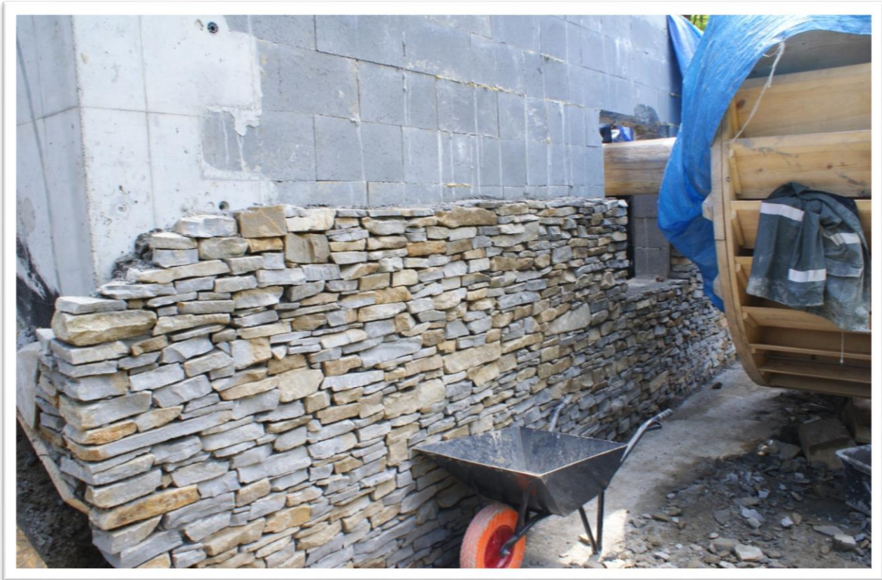
Folusz z Krościenka