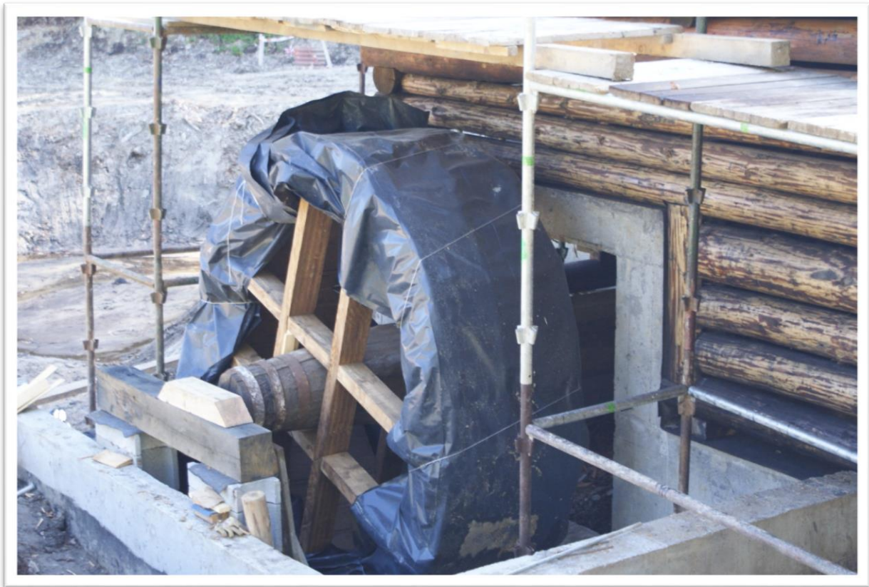
Tartak z Młodowa