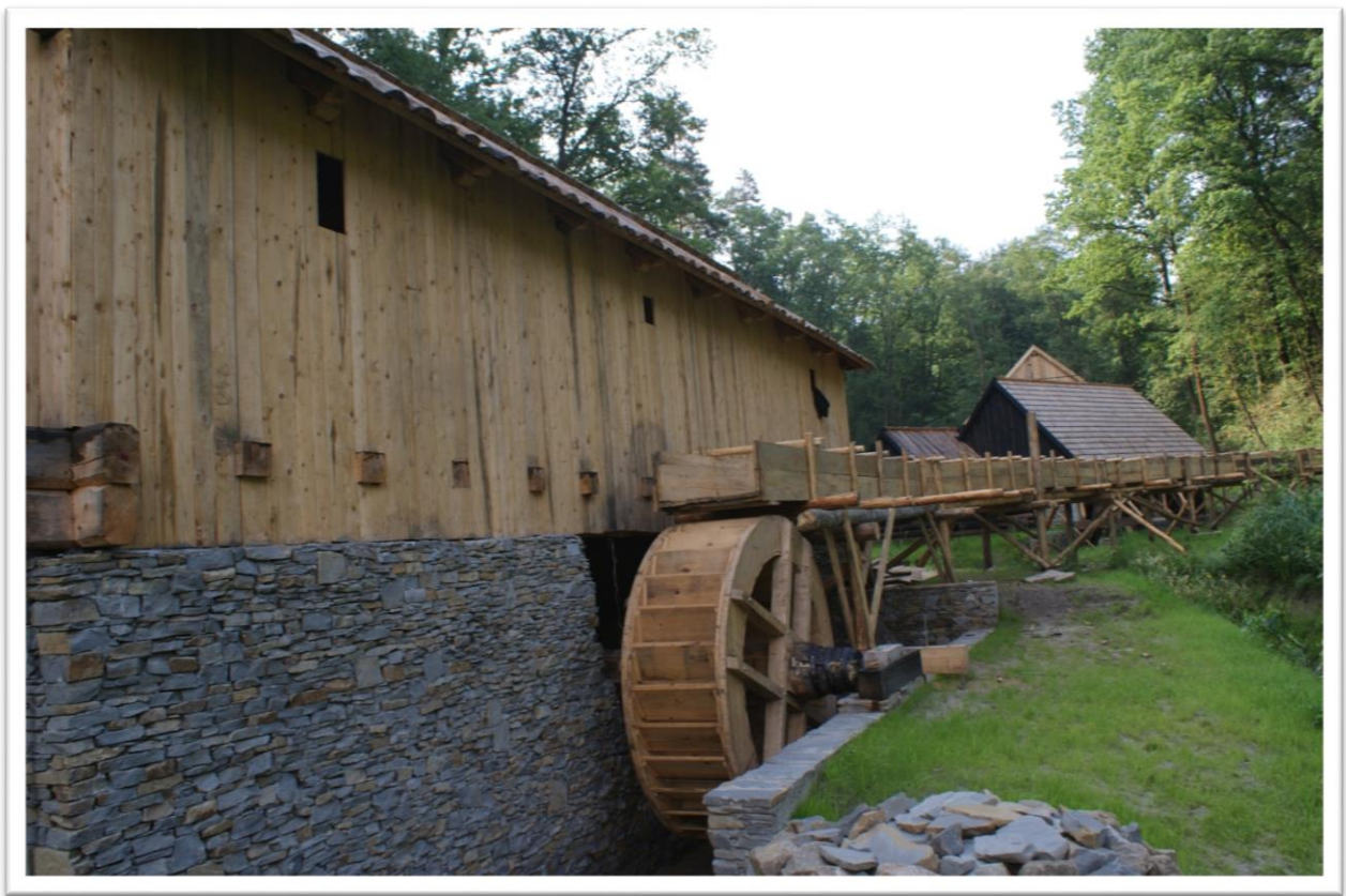
Folusz z Krościenka