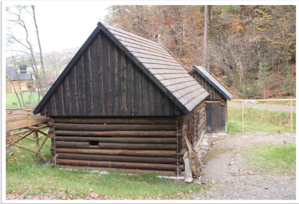
Dom Młynarza z Kamienicy