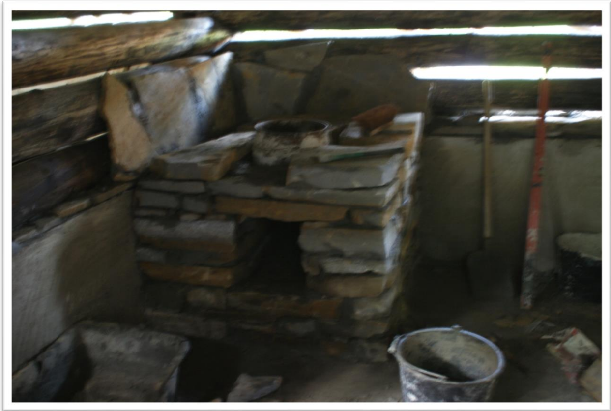
Dom Młynarza z Kamienicy