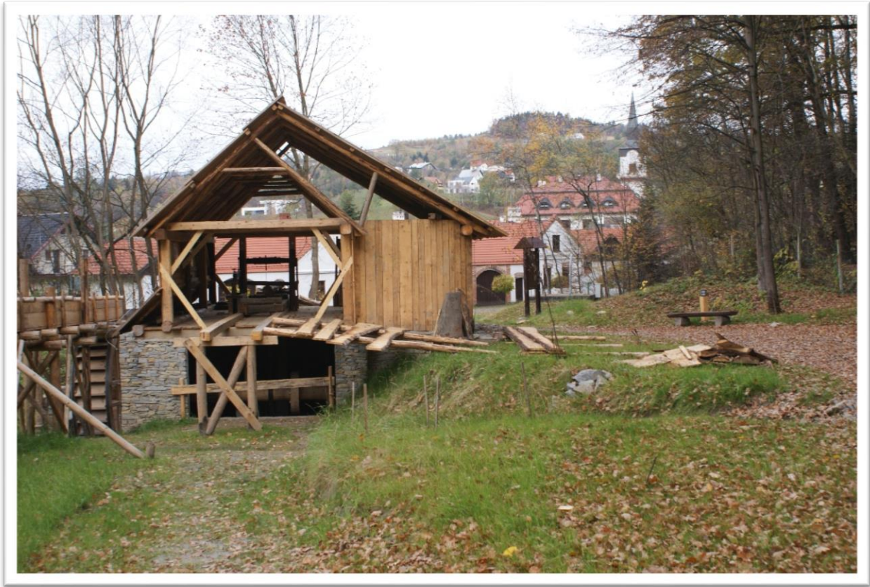
Tartak z Młodowa