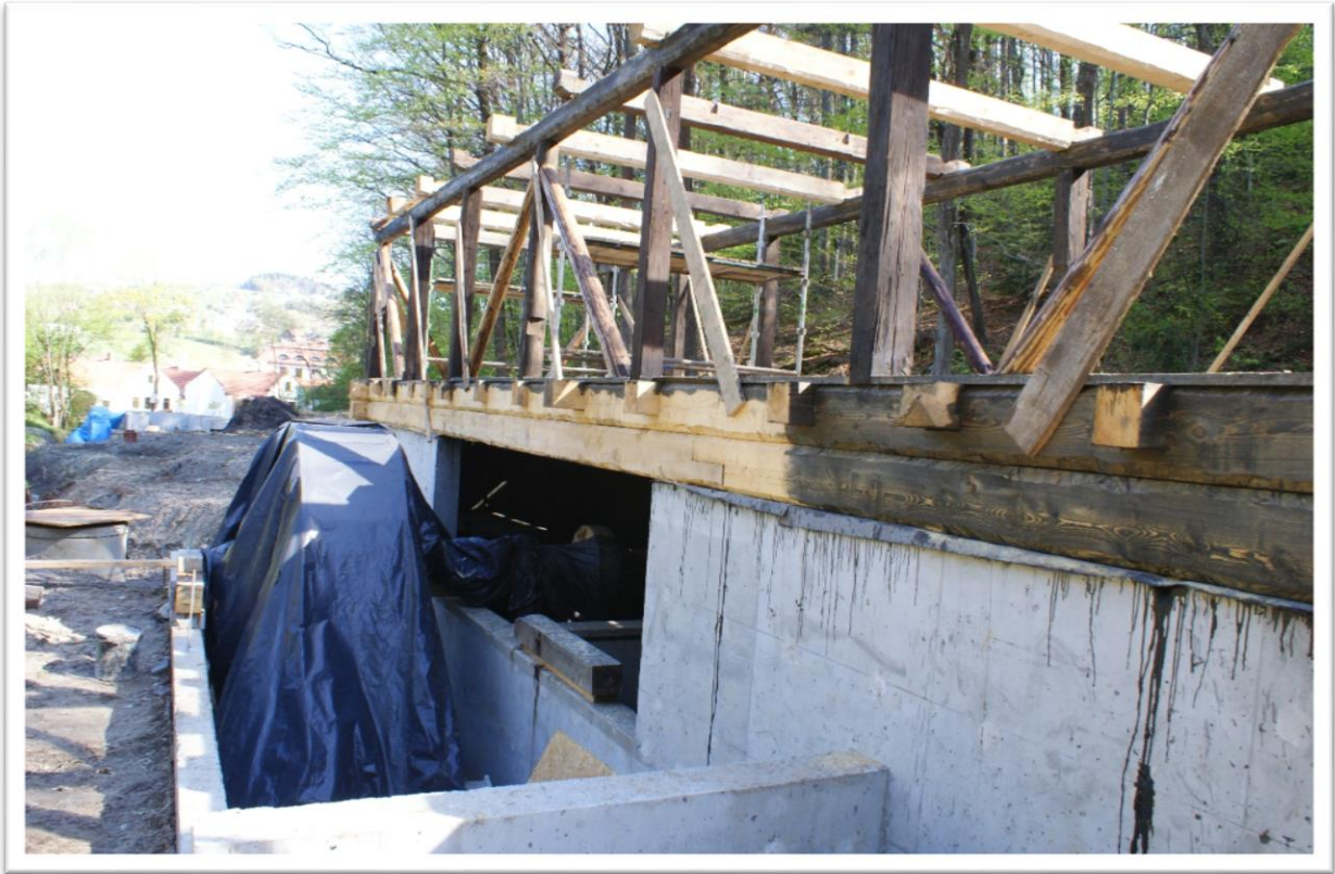
Folusz z Krościenka